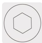
Entrada para llave allen