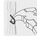
Uña para remover grapas