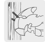
Tenaza para remover grapas