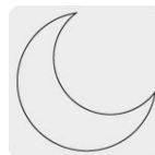
Uso de noche