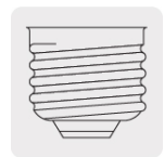
Base E26 / E27