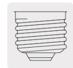
Base E26 / E27