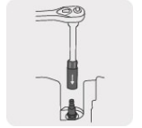
Inserto de neopreno