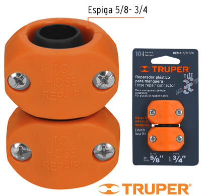
Espiga 5/8- 3/4

UNION MANGUERA PLASTICA "TRUPER". Fabricados en ABS, espigas para manguera en ambos extremos, resistentes a impactos. Conexión reparador.