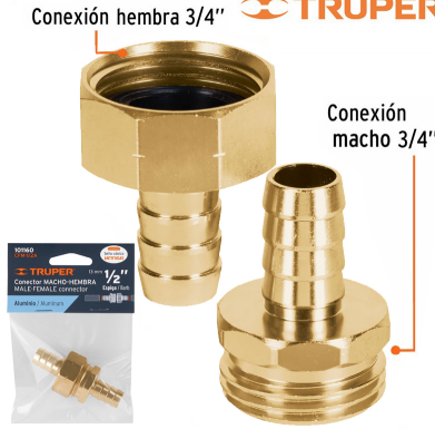
Conexión hembra 3/4"