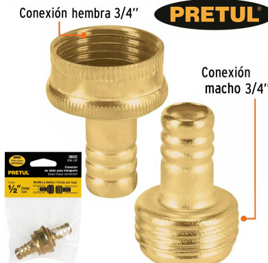
Conexión hembra 3/4"