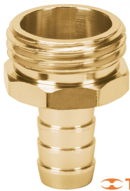
Conexión macho 3/4"