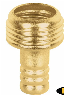
Conexión macho 3/4"