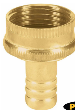
Conexión hembra 3/4"